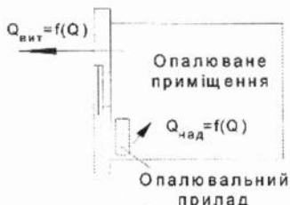
Рис. 2 Схема процесу самовирівнювання температурного режиму приміщення на сторонах витрати та надходження теплової енергії

Розглянемо приміщення, що опалюється (рис. 2). Якщо збільшиться віддача тепла опалювальним приладом, тобто збільшиться Q_{над} , то за рахунок збільшення температури всередині цього приміщення зростуть і втрати тепла, тобто Q_{вит} . В цьому випадку: Q_{вит} = f(Q) . При зменшенні втрат тепла, які відбуваються за рахунок збільшення зовнішньої температури, зростає температура всередині приміщення. А якщо підвищується температура, то неодмінно змінюється і віддача тепла опалювальним приладом, тобто: Q_{над} = f(Q) .